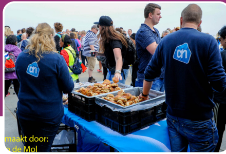
Maakt door: de Mol