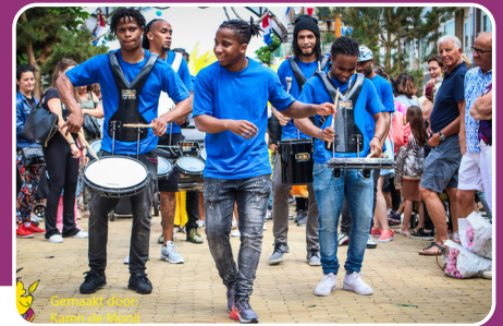
Maakt door: Kippenloop